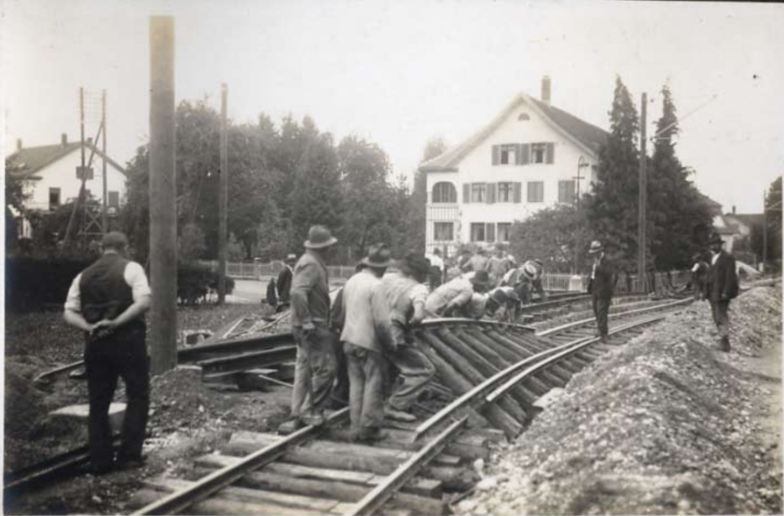
Démontage des anciens Laisés in Oberhofen.