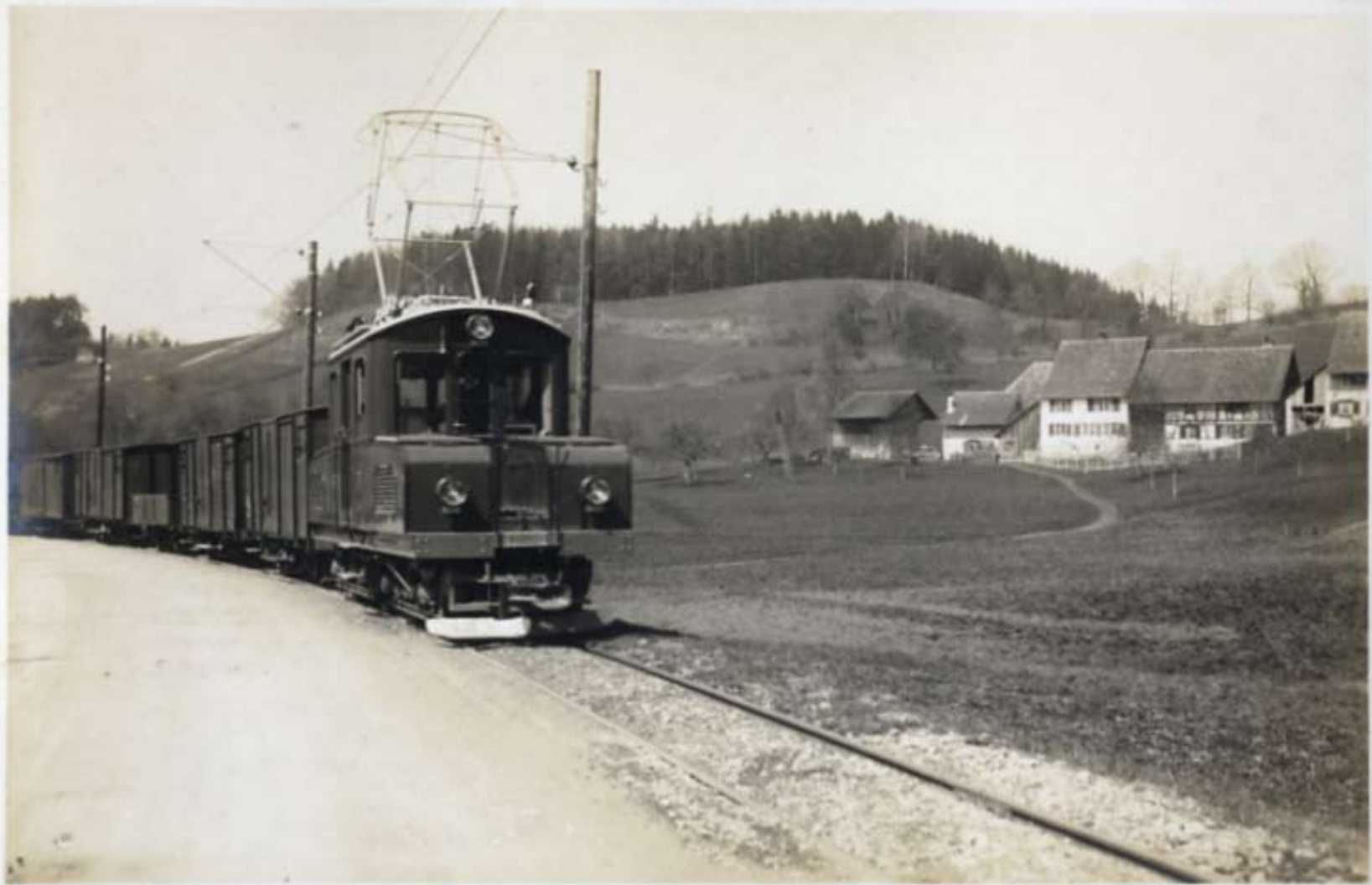
Der erste elektrische Güterzug