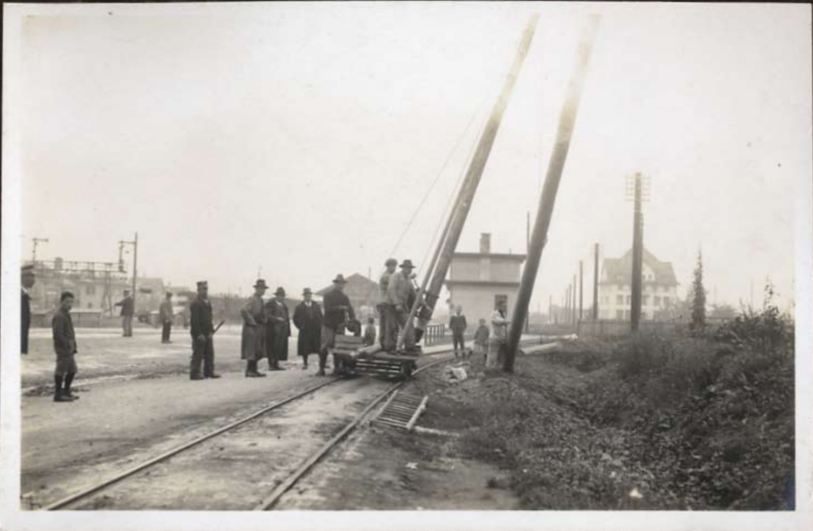
Stellen des ersten Holzmastes vor d. Bundesbahnhof in Wil (im Sept. 1920).