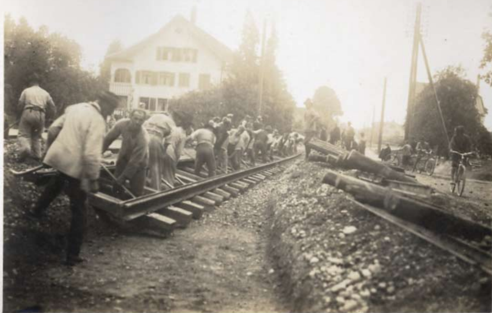
Die Rillenschienen werden eingeschoben.