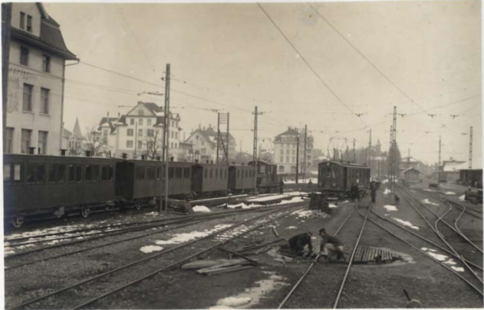
Umtriebsbahnhof in Wil.