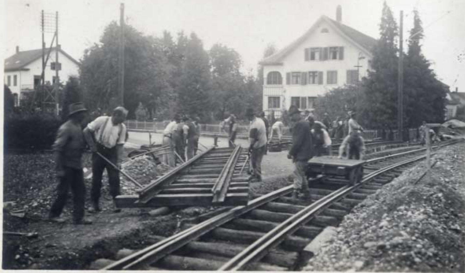
Anrücken der Rillenschienen für die Straßen- Kreuzung in Oberhofen.