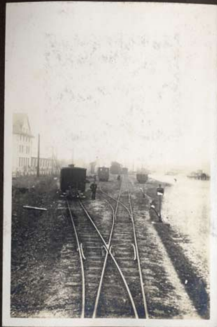
Der Verschiebebahnhof in Wil (Dampftrieb)