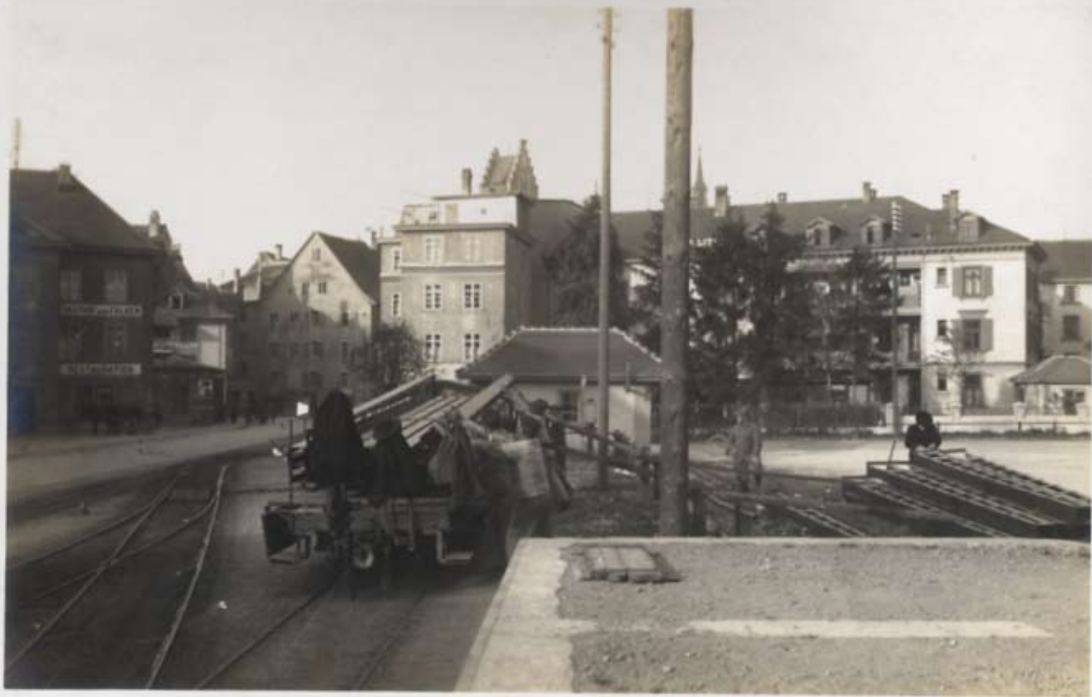
Die ersten Eisenmasken für die Stationen Frauenfeld.