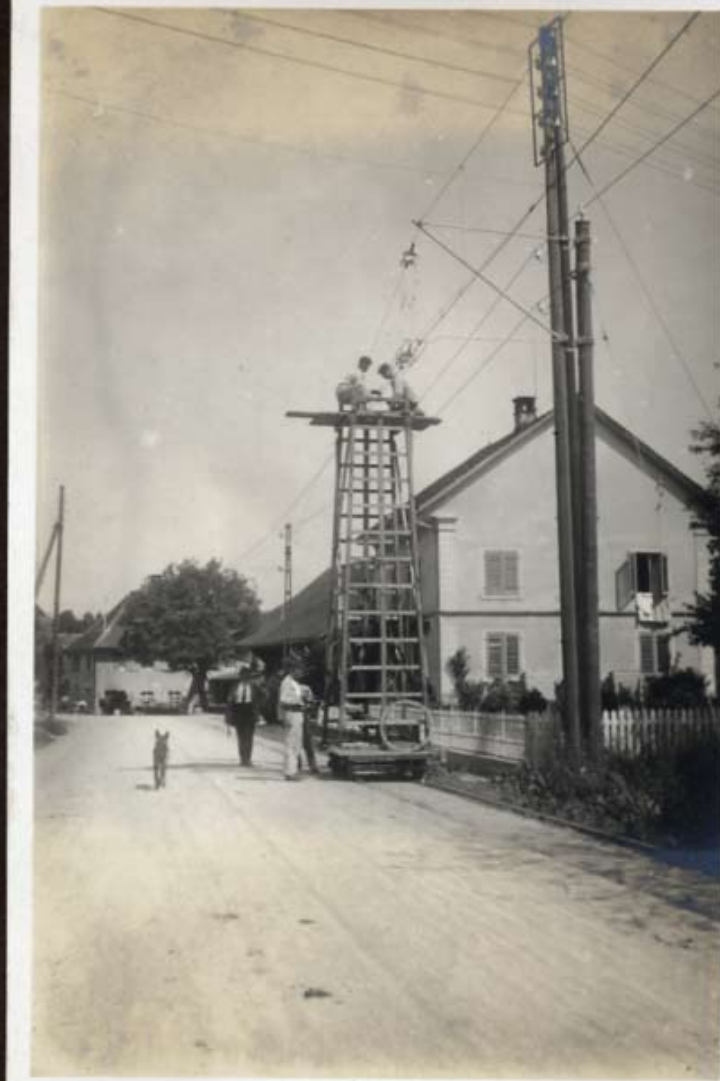
Montage eines Streckenunterbrechers in Matzingen