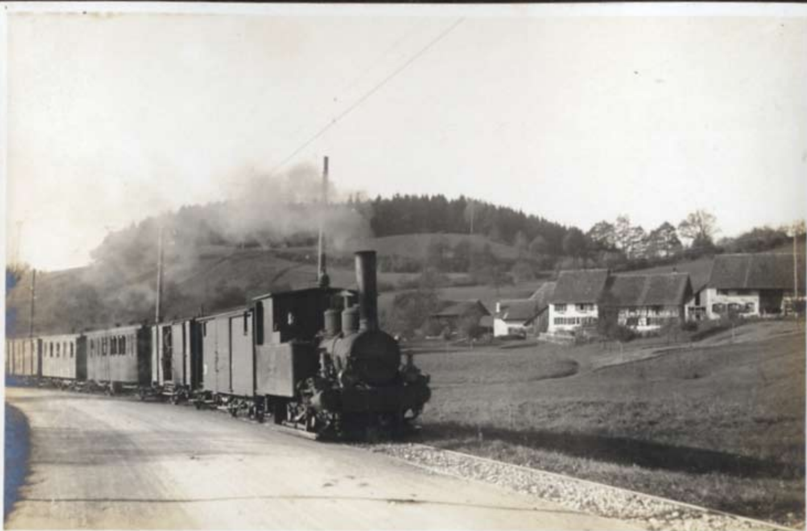
Der letzte Zug mit „Dampf“