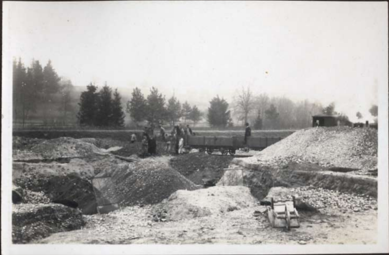
Wiedereinfüllen der Kiesgrube mit Schutt a. Bruchab Rosental.