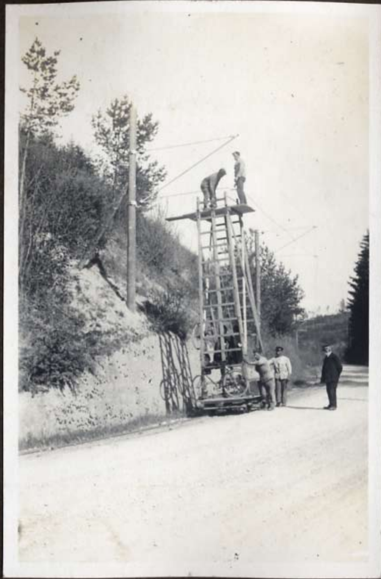
Beim Drahtzug im Fundwüchsen bei Frauenfeld.