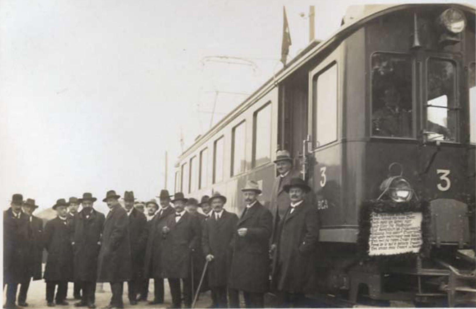
„Elektrisch nach Wil“