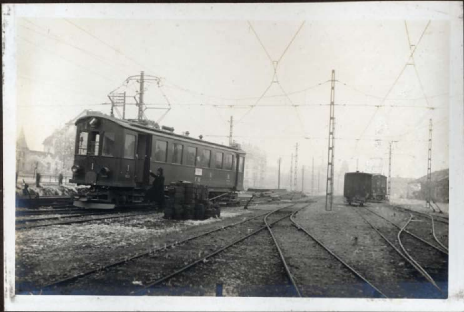
Die elektrischen Fahrzeuge auf dem Gleis d. F. W.