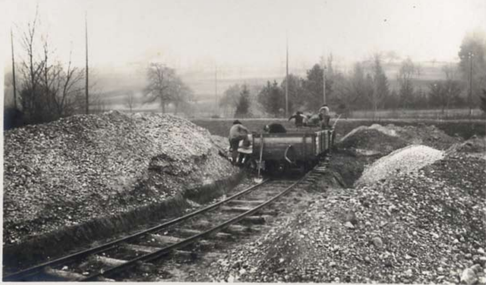
Kiesgrube mit Gleisanschluss für den Gleisumbau Rosental.