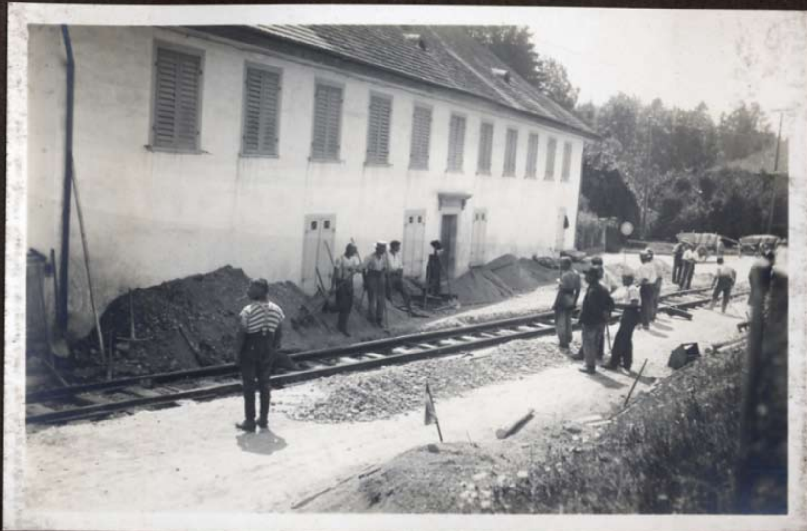
Einbau der Rillenschienen in die Straßenkreuzung, Wängi.