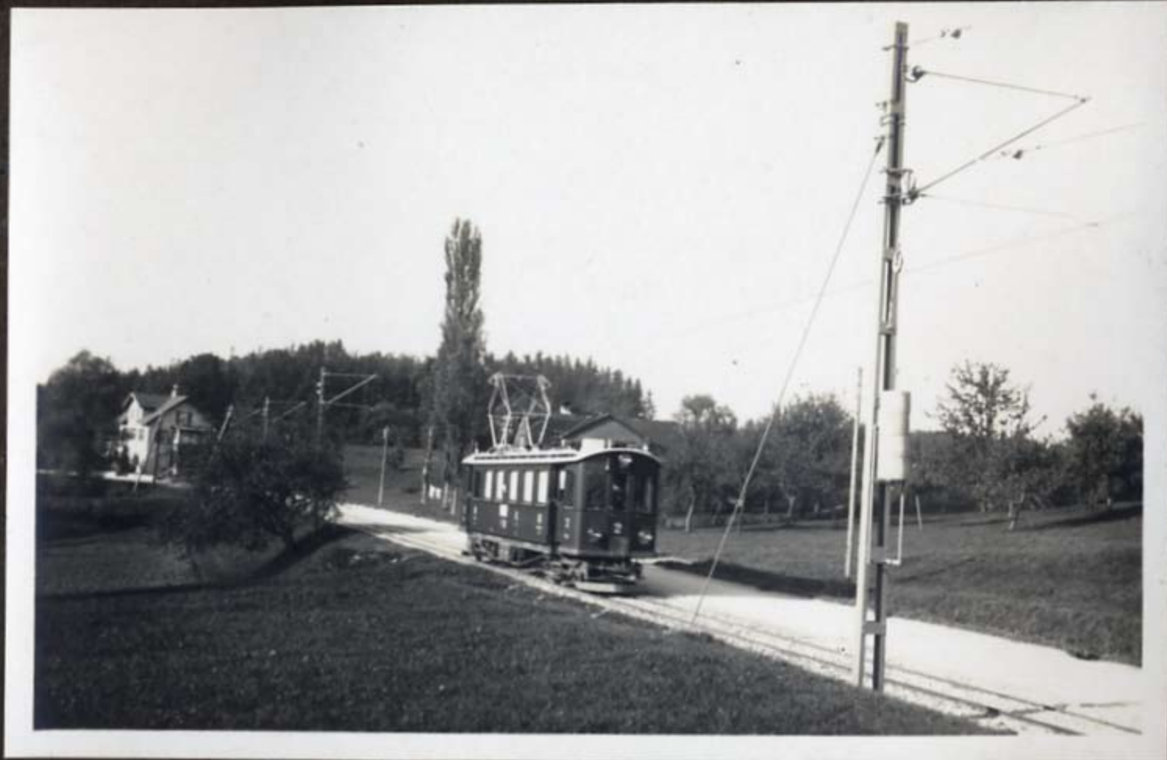
Elektrischer Probezug zwischen Rosental u. Münchwilen.