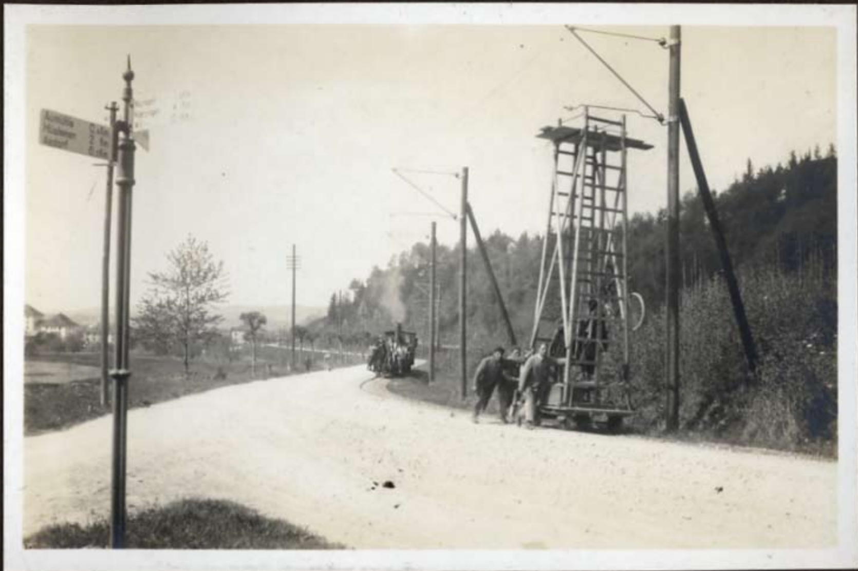
Nach dem Drahtzug; zurück zum Regulieren.