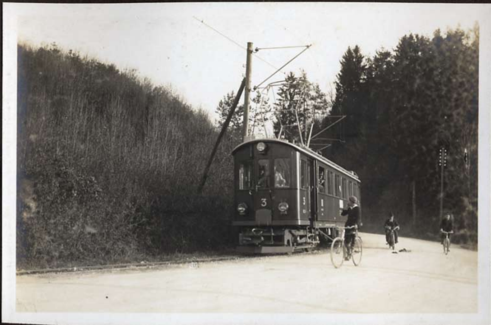
Der erste Zug im Mundsriicker Frauenfeld.