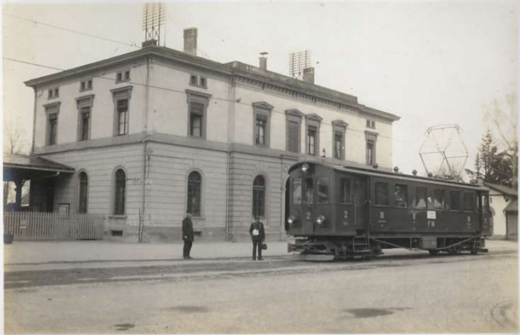
Frauenfeld S. B. B.