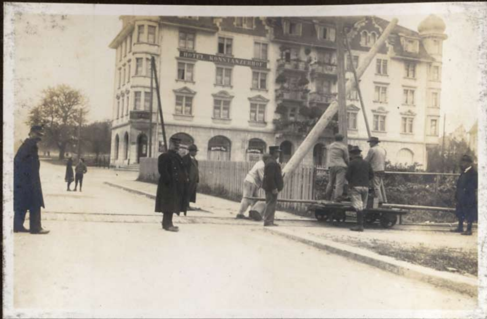
Einbringen des ersten Holzmaastes in Wil.