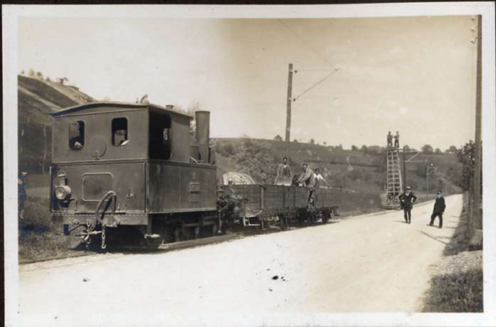
Die Dampflokomotive im Dienst d. Elektrifikation b. Drahtzug.